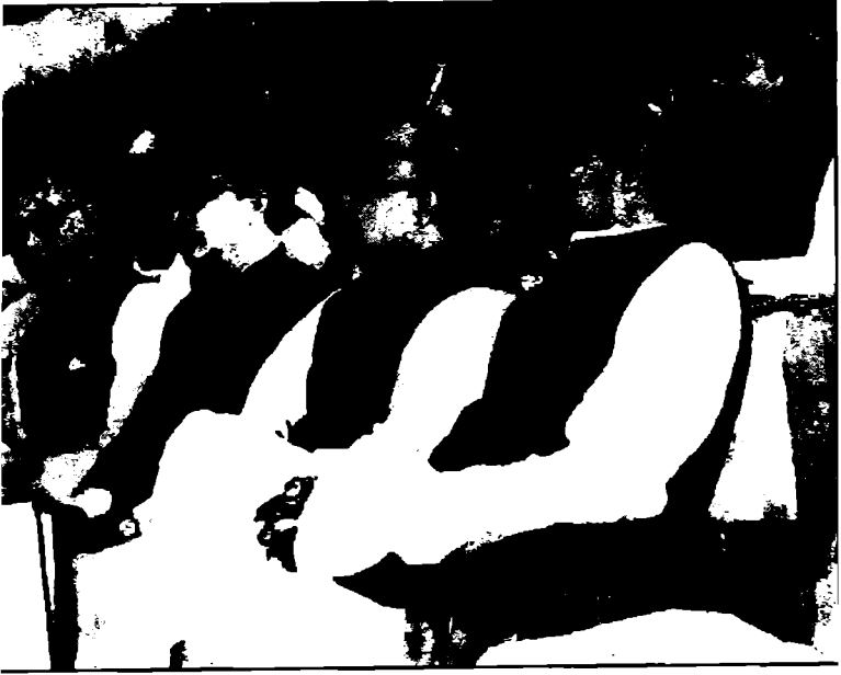
বঙ্গবন্ধুর পাশে সৈয়দ নজরুল ইসলাম, তাজউদ্দীন আহমদ ও এম. মনসুর আলী

হত্যাকাণ্ডের মধ্যে দিয়ে রাজনৈতিক পটপরিবর্তনের প্রেক্ষিতে ওনাদেরকে বন্দী করা হয়। ফোনালোপে ওনার কাছ থেকে জানতে পারি সেই ভয়াল রাতের ঘটনা।